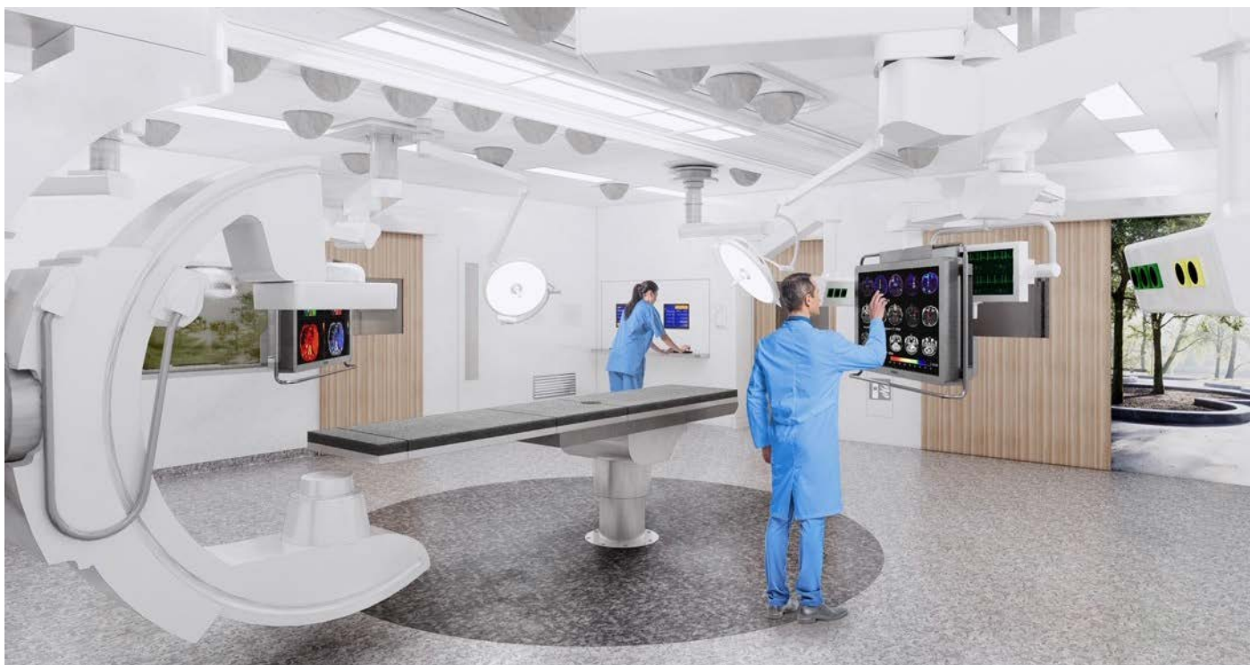
Design och bild EGM Architects