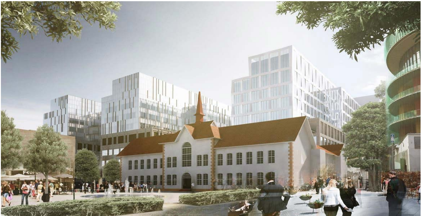
Nya sjukhusbyggnaden Malmö har valt Opragon för säkra och bekväma operationer i 35 salar. Design och bild White Arkitekter.