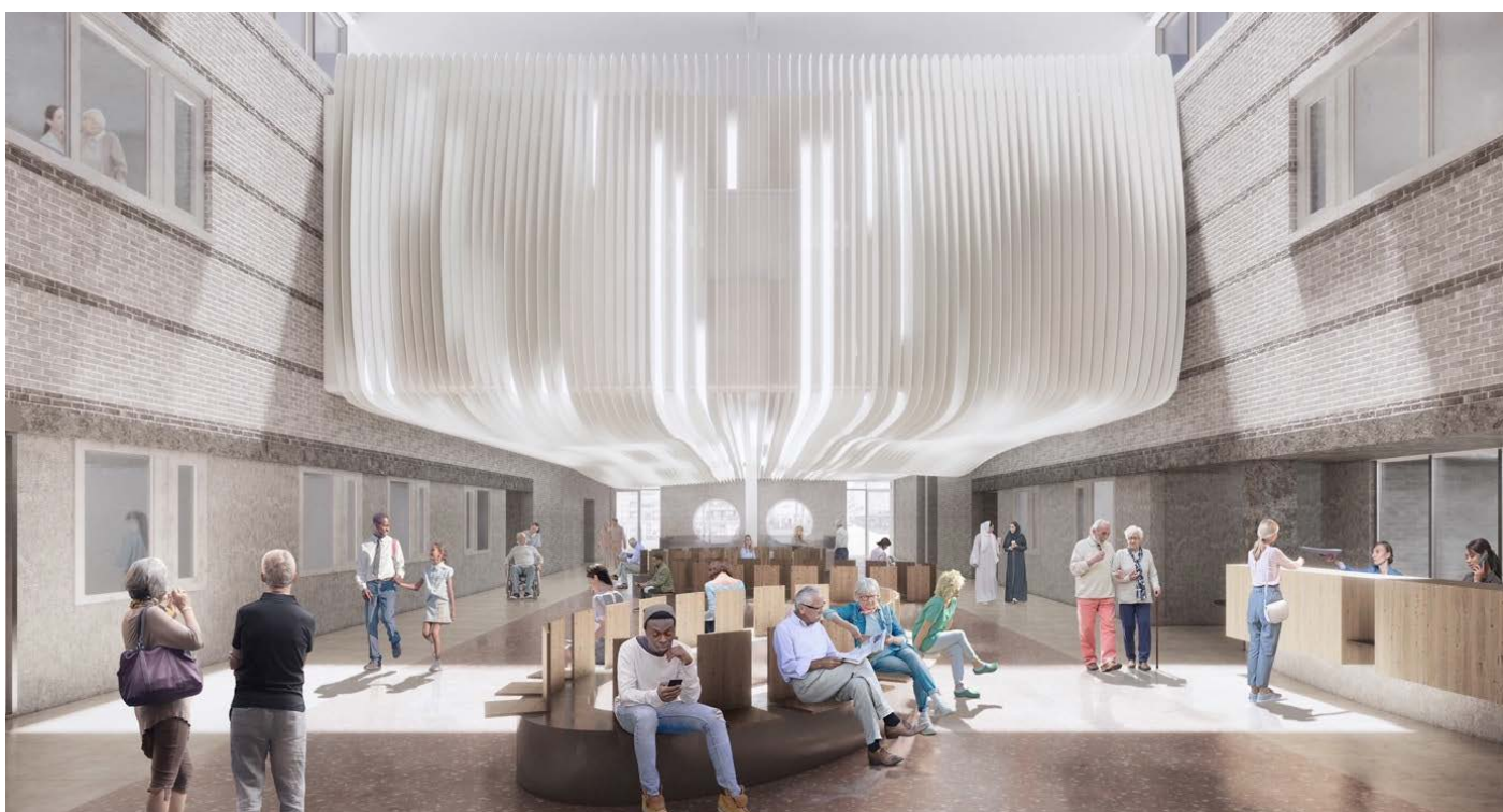
De nya hybridrummen hängs upp i atriumet. Design och bild EGM Architects